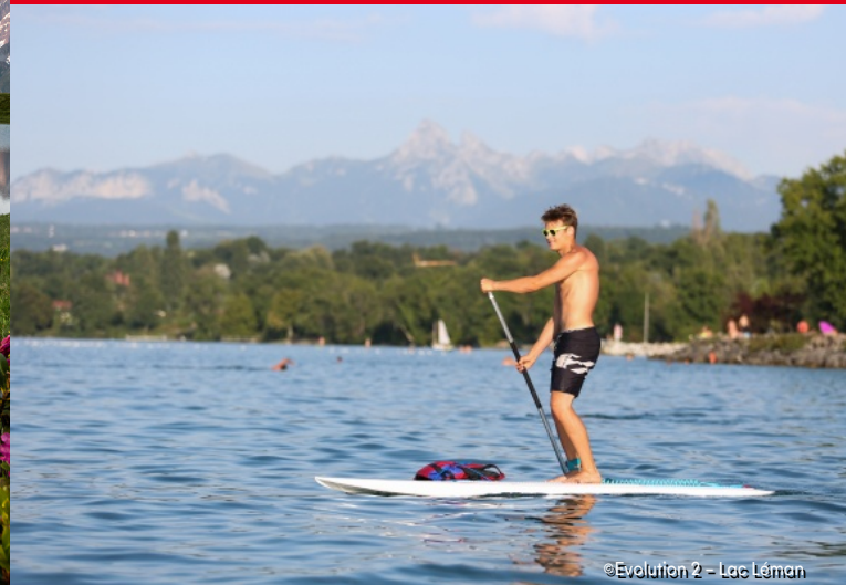
©Evolution 2 - Lac Léman