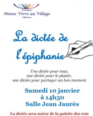
© DR Mieux vivre au village